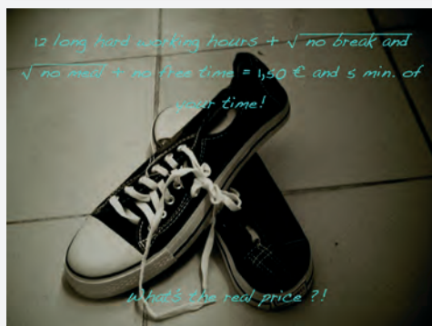
Maciátka, Dolný Kubín, Slovensko

Třetí, závěrečný rok projektu byl ve znamení intenzivních mezinárodních aktivit. První z nich byla mezinárodní soutěž s názvem Zrcadlo světa u nás doma. Hlavním úkolem pro soutěžící bylo rozhlédnout se kolem sebe a najít ve svém okolí konkrétní příklad, který ukazuje propojenost mezi zeměmi globálního Severu a Jihu, a tuto souvislost vyjádřit prostřednictvím obrázku, koláže či fotografie. Soutěžilo se ve dvou kategoriích na národní i mezinárodní úrovni, kde díla hodnotila odborná porota. Nejlepší dílka ze všech zemí byla postupně vystavena ve všech partnerských státech.