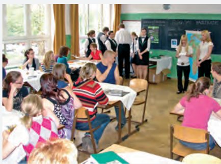
Hotelová škola v Plzni, školní akce

způsob jak je kontaktovat. Častými partnery byly přímo městské úřady, které mají samozřejmě na dění v komunitách velký vliv, dále pak neziskové organizace zabývající se např. životním prostředím, globálním rozvojovým vzděláváním nebo soukromé firmy. Pro oslovení partnerů týmy využily briefing paperů nebo ukázek