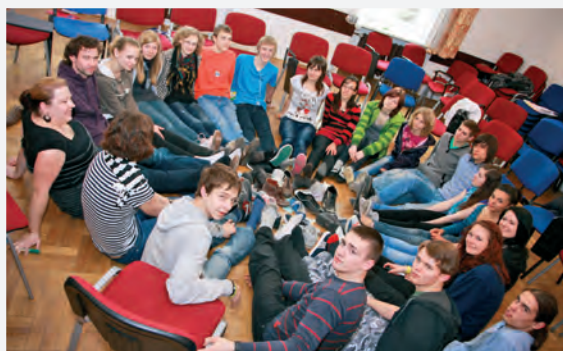
Mezinárodní workshop v polském Krakově

Významnou mezinárodní událostí bylo setkání vybraných školních týmů v polském Krakově. Pedagogové zde měli možnost porovnat činnost jejich školy s ostatními, dozvědět se, jak začleňují globální rozvojové vzdělávání do výuky v jiných evropských zemích, a vyzkoušet si nové aktivity využitelné ve vý-