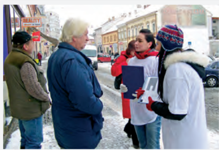
SOŠ Volyně, místní akce

svých výsledků z pořádání školních akcí. Celkem proběhlo 11 místních akcí s různými cíli. Některé informovaly o palčivých problémech týkajících se vody, obchodních podmínek na světovém trhu, jiné aktivně vyjednávaly získání statutu Fairtradové město pro svou obec. Obecně měly akce směřovat k ustavení dlouhodobější spolupráce mezi školou a těmi partnery, kteří jsou motivováni se tématům udržitelného rozvoje a spravedlivějších obchodních vztahů dále věnovat.